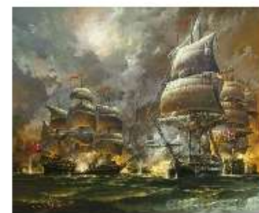
Сражение у мыса Калиакрия