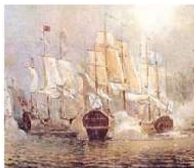
Сражение у мыса Тендра