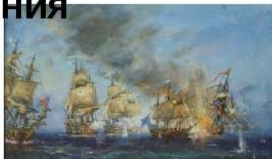
Керченское морское сражение