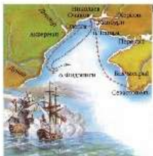
Бой у острова Фидониси