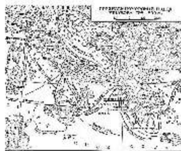
Действия в Средиземном море